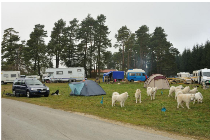
Stake-Out Platz mit Team Kaneeli

Der Stake-Out Platz, eine Wiese am Sportheim, war genügend groß und mit einer schönen Aussicht und füllte sich bis Samstags zusehends. Wir wurden von den bereits Anwesenden sehr herzlich begrüßt.