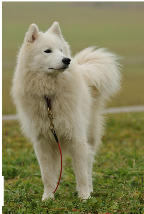
Little Rocky Ruff River Koyuk