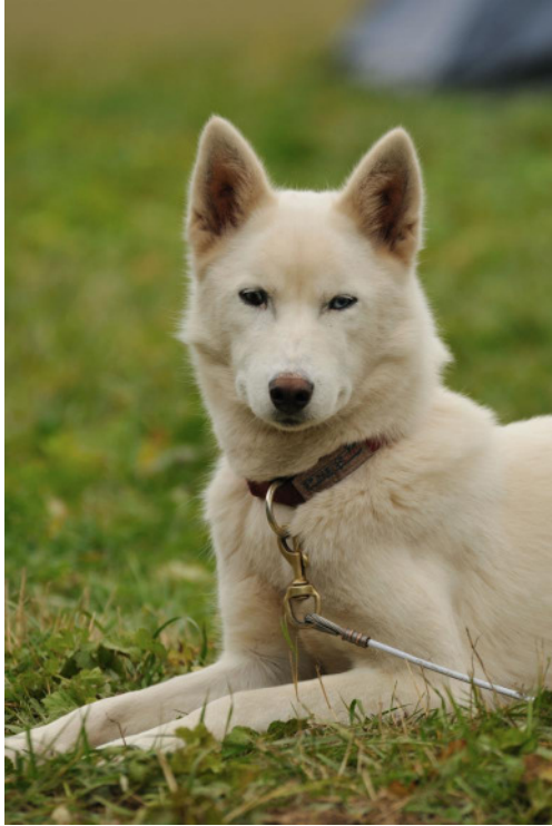
Weiß, aber doch kein Sammie ☺