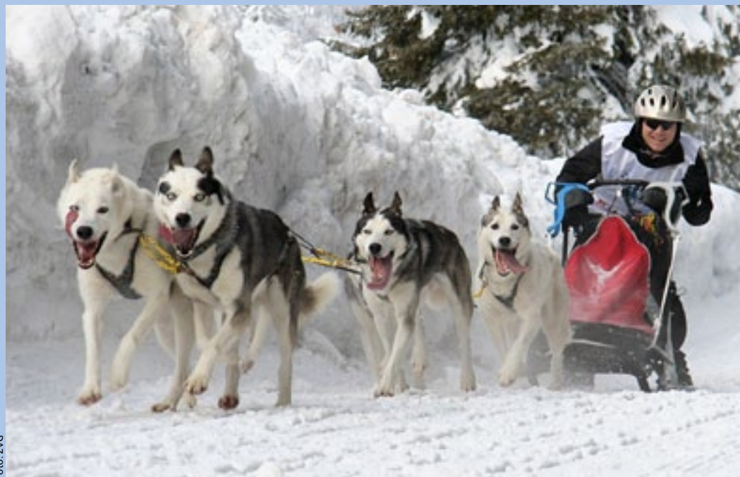
«Wenn einen das Schlittenhunde-Fieber einmal gepackt hat, ist es geschehen», sagt René Weber. Er besitzt total zehn Siberian Huskies und legt mit ihnen im Trainingsaufbau von September bis Dezember gegen 700 Kilometer zurück.

René Weber: Wie alle anderen Musher hoffen wir im Dezember stets auf viel Schnee, damit wir auf den Hundeloipen, von denen es in der Schweiz zwei gibt, trainieren können. Eine Loipe befindet sich im Jura, die andere auf dem Urnerboden. Es gibt im Dezember auch sogenannte Trainingslager, etwa in Kandersteg. Ausserhalb dieser Zeit kann man dort aber nicht trainieren. Zudem finden einige Trainingslager im Ausland statt, wo es ebenfalls spezielle Hundeloipen gibt – etwa in Frankreich, Italien oder Deutschland. Je nach Schneelage entscheiden wir meist spontan, wohin wir fahren.