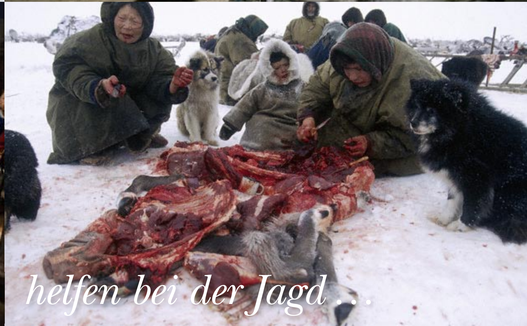
helfen bei der Jagd ...