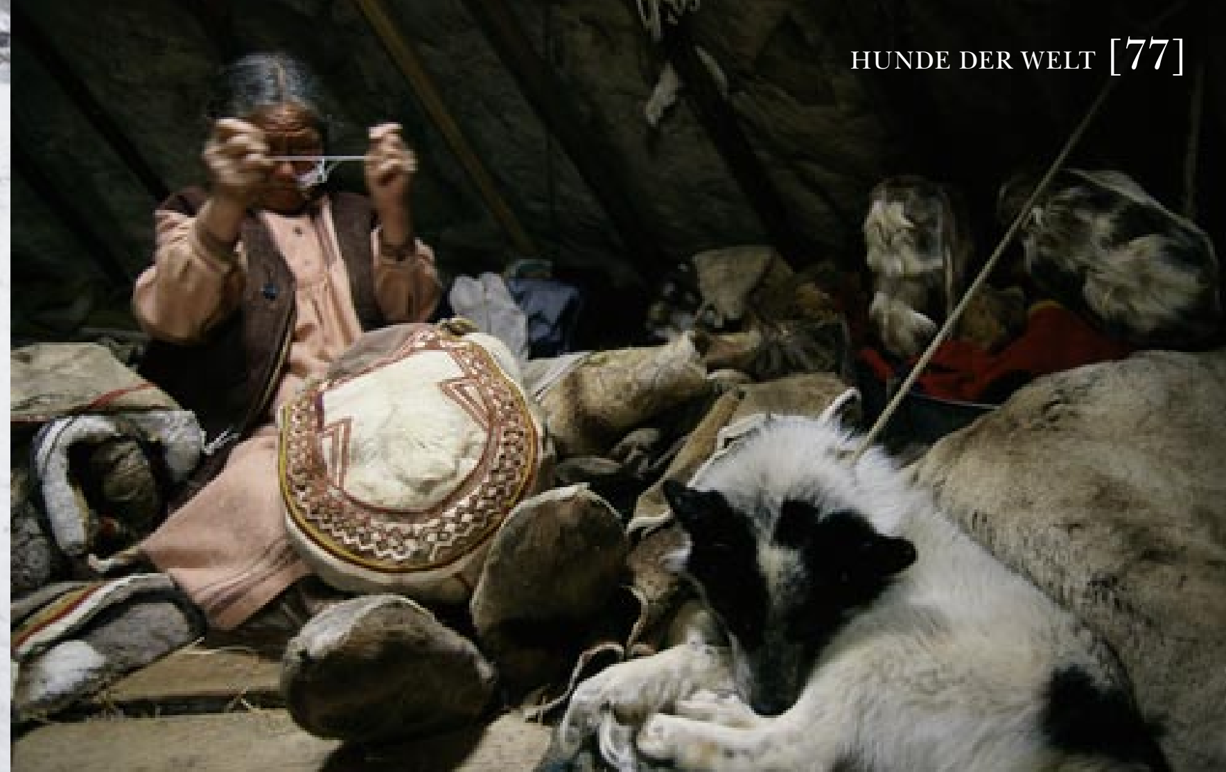
Bei den Nenzen herrscht strikte Arbeitsteilung: Die Männer kümmern sich um die Herde und die Jagd, die Frauen um das Zelt, die Kleidung, das Essen und die Kinder. Die Hunde sind immer dabei. Sie dürfen jederzeit mit ins Zelt, denn sie nützen den Menschen: Nachts wärmen sie ihre Besitzer. Wenn die Frauen die Rentierfelle entfleischen, sitzen die Hunde dabei und hoffen auf ihren Anteil.