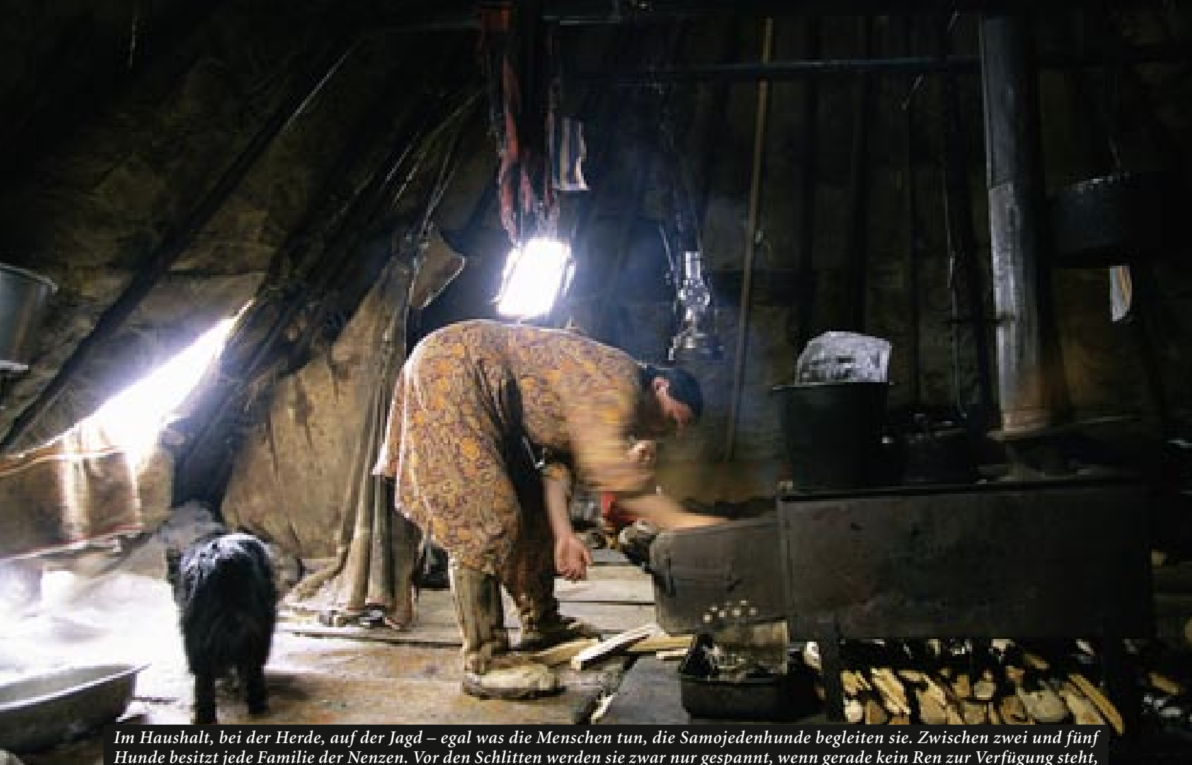
Im Haushalt, bei der Herde, auf der Jagd – egal was die Menschen tun, die Samojedenhunde begleiten sie. Zwischen zwei und fünf Hunde besitzt jede Familie der Nenzen. Vor den Schlitten werden sie zwar nur gespannt, wenn gerade kein Ren zur Verfügung steht, als Begleiter aber sind sie willkommen. Und wichtig, denn jedes Kind in der Tundra weiß: Zieht ein Sturm auf, können die Hunde das Leben retten. In beißender Kälte wärmen sie, in der Schneewüste, die der Sturm hinterlässt, finden sie den Weg zurück ins Lager.

Tiere, die einem helfen, gehören zur Familie. Der Stolz der Nenzen sind ihre Rens. Mit ihnen tragen sie Rennen aus, für sie werden aufwändige Halfter geknüpft, sie sind Teil ihrer Riten. Den Hunden aber vertraut man. Sie gehören dazu und haben ihren festen Platz in der Gemeinschaft. Sitzt die Familie im Kreis, um zu essen, formieren sich die Hunde hinter ihnen zu einem zweiten Kreis und fangen auf, was für sie abfällt. Gehen die Kinder zum Spielen nach draußen, passen die Hunde auf, fahren die Männer mit dem Schlitten weg, laufen die Hunde neben ihnen her. Jedes Kind der Tundra weiß, dass es sich bei einem aufziehenden Schneesturm an den Hund krallen muss. Im Sturm wird er es wärmen, nach dem Sturm bringt er es nach Hause.