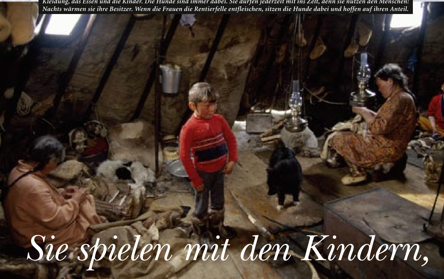
Sie spielen mit den Kindern,